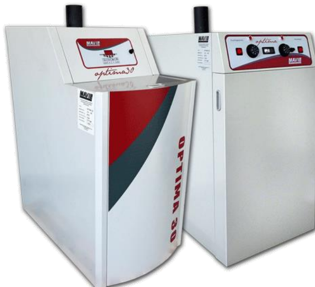
ΑΤΟΜΙΚΗ ΜΟΝΑΔΑ ΠΕΤΡΕΛΑΙΟΥ "Optima"

τα οποία περικλείονται σε ένα μεταλλικό κάλυμμα.